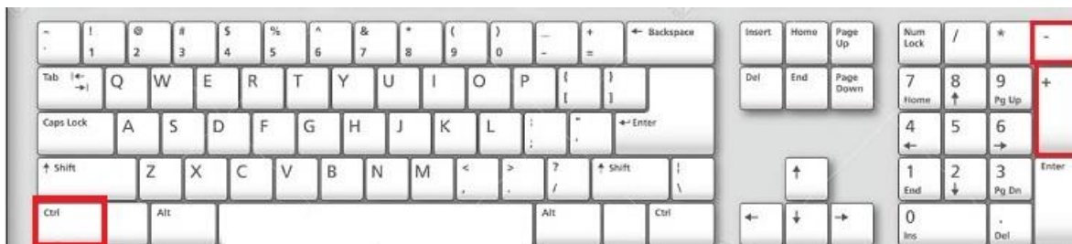
Imagen 3. Zoom en Windows.